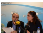
ЕФН: Солидарност со новинарите во Турција

Европската и Меѓународната федерација на новинари (ЕФЈ/ИФЈ) организираа прес конференција во Прес клубот во Брисел за да го искажат својот протест против блокирањето на медиумите во Турција и да ја повикаат владата да ја отповика забраната на информативни канали.