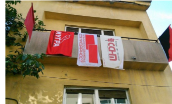
Влезот во СЦ Дуња