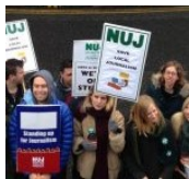
НУЈ стави на маса барање за покачување на платите

Состојбата во Newsquest го илустрира страдањето на новинарите. 11 работни места се укинуваат во неговите севернолондонски весници каде 27 од 29 работници се известени дека се технолошки вишок.